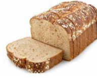
Ngũ cốc nguyên hạt, bột yến mạch, bột mì, mì ống, bánh mì và gạo lứt