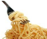
Mì ống trắng, mì, spaghetti