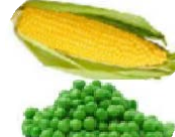
Ngô và đậu Hà