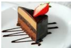
Bánh, bánh quy,

Hạn chế thực phẩm carbohydrate nhiều chất béo, lượng đường cao – quá nhiều đường (>10 gam) và/hoặc quá nhiều chất béo bão hòa (>3