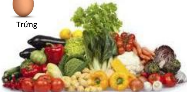
Tất cả các loại rau TRỪ khoai tây, đậu Hà Lan và ngô