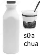
Sữa ít béo