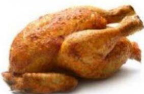
Gà, gà tây